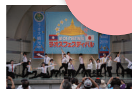
ラオス学校プロジェクト

「ラオスに学校プロジェクト」の一環として、生徒有志を募りラオスを訪問。学校を寄贈した村での開校式、運動会、ホームステイを通して、日本では経験できない文化や暮らし、人との交流を楽しみます。参加した生徒からは「新しい世界に触れることで「夢や目標が見つかった」「新しい自分を発見した」「家族の大切さを見つめ直せた」という声が多く聞かれ、成長の場となっています。