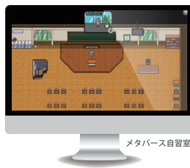
メタバース自習室

「たまごっちでひーきに」(バンダイ) / 「逆転検事」(カプコン) / 「機動戦士ガンダムSEEDシネマトイピング」(サンライズインタラクティブ) / 「アルカノイドR2」(タイトー)など